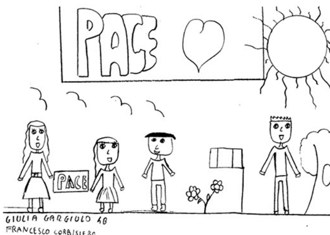
Disegno Giulia Gargiulo Francesco Corbisiero 4 A B